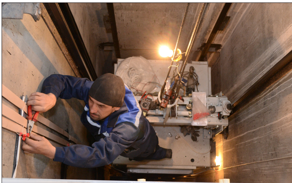
В многоквартирных домах Пензы (№ 6 по ул. Глазунова, №2/1 по ул. Глазунова/Онежской и №14 по ул. Фабричной) начались работы по замене лифтового оборудования.